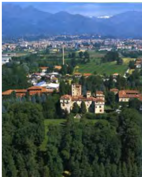
Foto 2 - Il complesso visto a volo d'uccello da sud verso nord in rapporto al territorio biellese (da CHIOCCETTI 2001)