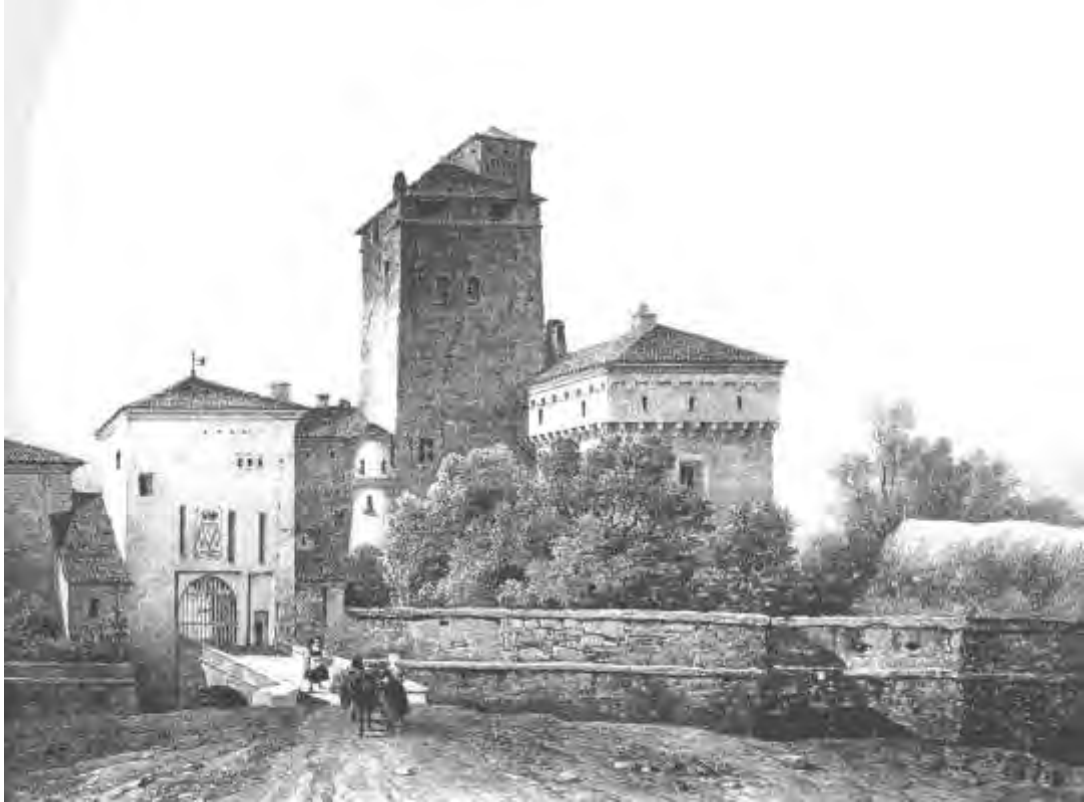
Icon 5 - E. GONIN, castello di Gaglianico