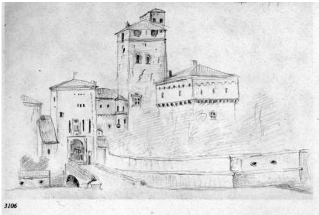
Icon 4 - C.ROVERE, Gaglianico , n. 3106