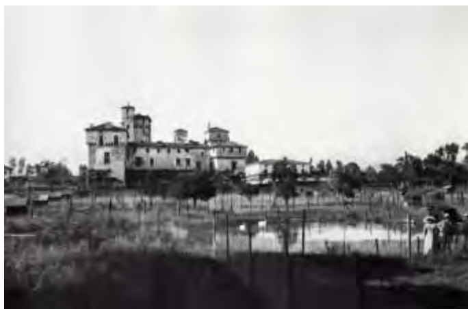
Foto 1 - Veduta del castello da sud in una foto storica (da CHIOCCETTI 2001)