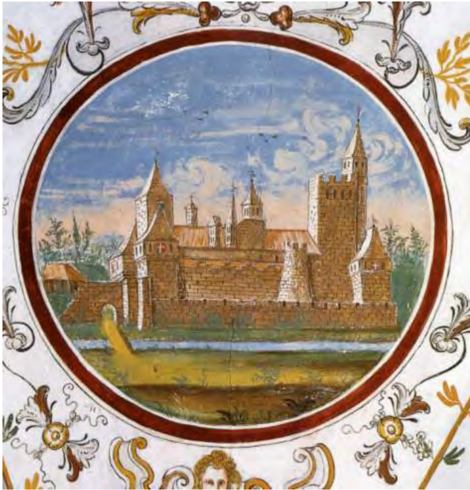
Icon 3 - Affresco rappresentante il castello di Gaglianico nel Palazzo Lamarmora di Biella