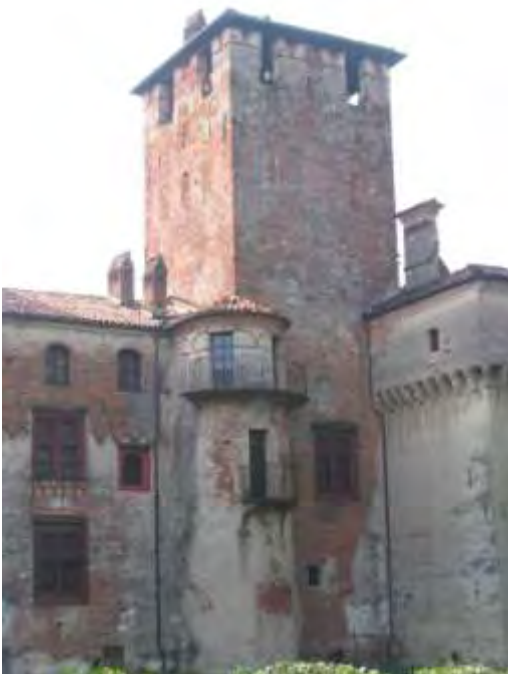
Foto 7 - Prospetto nord con la torre quadrata e in basso addossata quella semicircolare