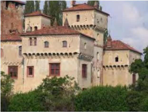
Foto 5 - Torre d'angolo sud est