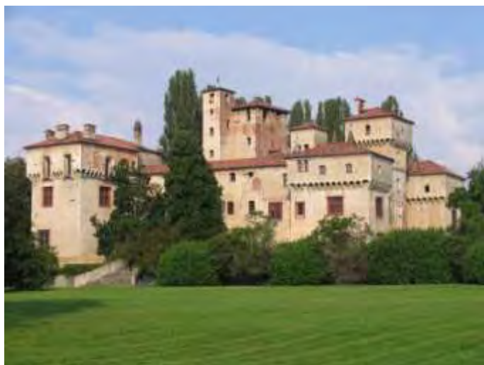
Foto 3 - Prospetto sud dal giardino del castello