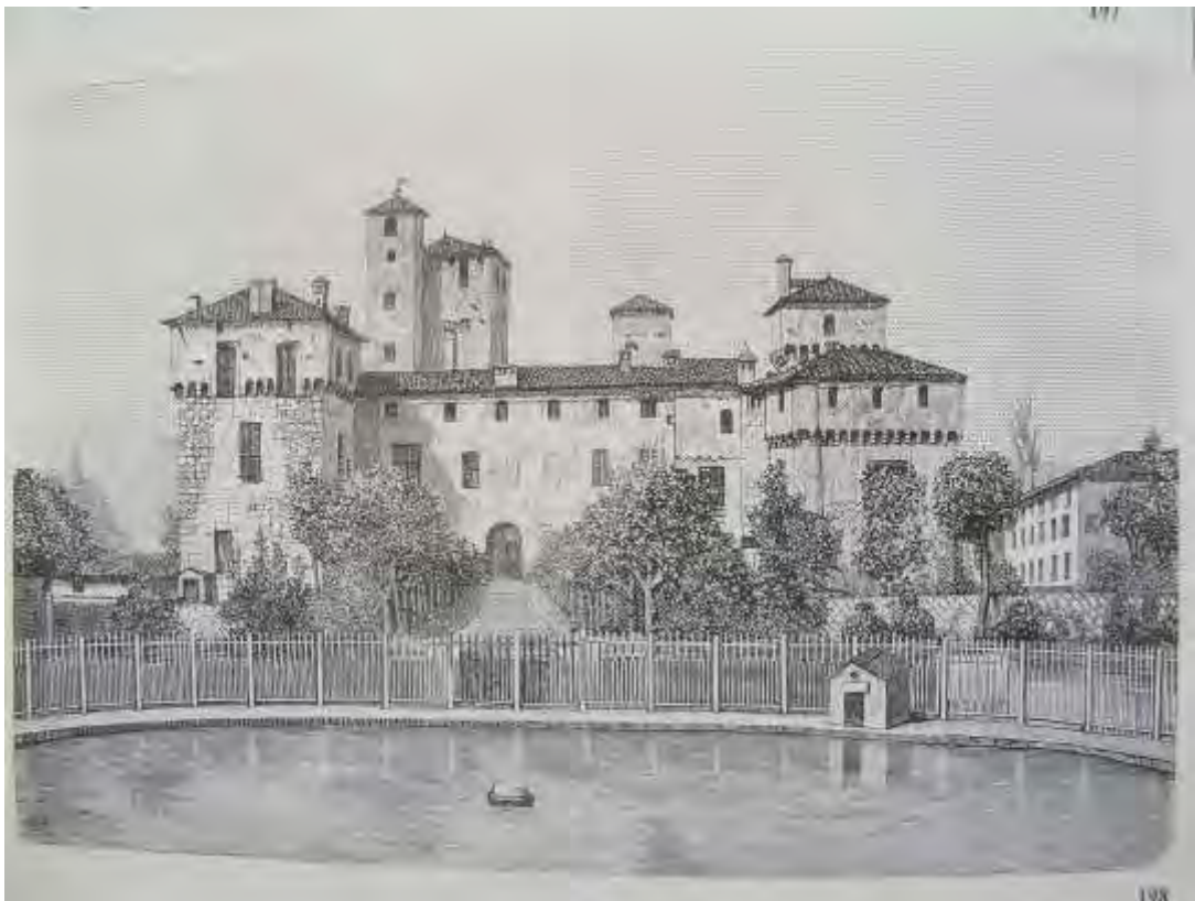
Icon 6 - Gaglianico castello, in Le Cento Città d'Italia