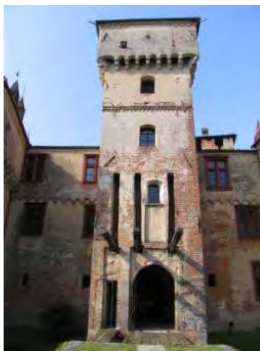
Foto 4 - Torre d'ingresso al castello con il sistema dei bolzoni per il ponte levatoio