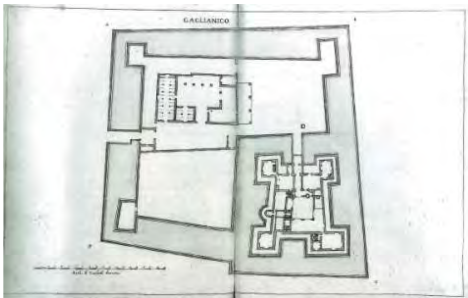
Icon 2 - C. MORELLO, Gaglianico , Avvertimenti sopra le fortezze , Biblioteca Reale di Torino, Militari 178, ff. 80v-81, da M. Viglino Davico (a cura di), Fortezze «alla moderna» e ingegneri militari del ducato sabaudo , Torino 2005, fig. 133