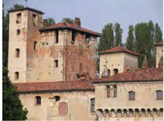
Foto 6 - Prospetto sud con la parte sommitale delle due torri quadrate interne al complesso