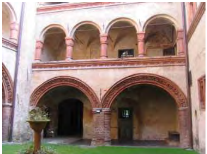
Foto 8 - Interno del cortile con il porticato a piano terra e il doppio loggiato superiore